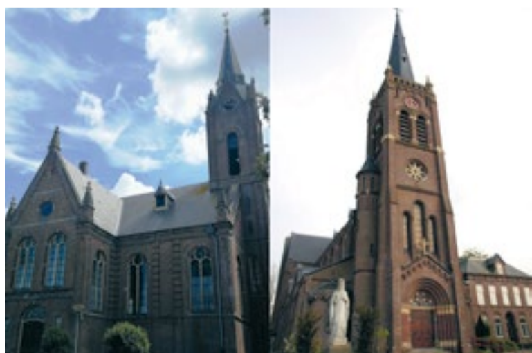
De Berkhouter kerk (links) en de Sint Victorkerk in Obdam bieden tijdens de Open Monumentendagen een kijkje in de rijke geschiedenis van de historische bouwwerken.

In het weekend van 12 en 13 september zijn in Koggenland twee kerken open voor publiek, in het kader van de Open Monumentendagen. Op zaterdag 12 september kunnen geïnteresseerden een kijkje nemen in de Sint Victorkerk in Obdam en op zondag 13 september opent de Berkhouter kerk de deuren voor bezoekers.