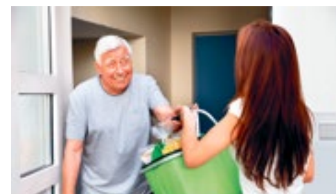
Hulp voor mantelzorgers p.2

Kijk voor meer informatie over De Bemiddelingskamer op www.debemiddelingskamer.nl of bel (06) 39 40 66 97. Meer informatie over het Zorgteam is te vinden op koggenland.nl/zorgteam . Het Zorgteam is te bereiken op telefoonnummer (0229) 54 83 70 en via zorgteam@koggenland.nl .