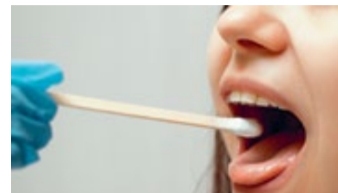
Afspraak voor coronatest ook online te maken p.4