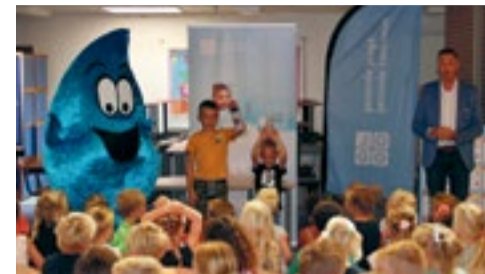
Drinkwater - de ideale dorstflesser p.2